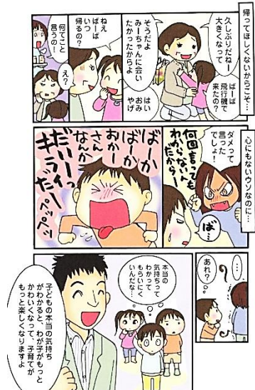
「子どもの本当の気持ちが見えるようになる本」(すばる舎)より